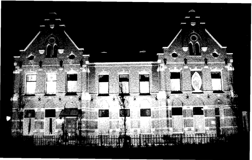
De pastorie thans, badend in het licht van drie schijnwerpers.

Kort na zijn vertrek naar Po'a ging Eustachius voor een vakantie terug naar Europa en bezocht naast Brabant en Roelofarendsveen ook de Franse plaats Lourdes. In deze bedevaartsplaats, waar de rooms katholieken Maria vereren, sloeg hij een voorraad Lourdeswater in (gewijd water uit de bron bij de grot, waarin Maria aan een herderinnetje zou zijn verschenen) en nam dit mee terug naar Brazilië. Zijn plan was om met dit water het plaatselijke volksgeloof, het spiritisme, de loef af te steken en hij begon propaganda te maken om bij ziekte gebruik te maken van de genezende eigenschappen van het gewijde Lourdes-water.