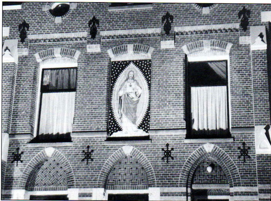
Het tegeltableau in de voorgevel van de pastorie met de afbeelding van het Heilig Hart in aureool.

Voor dit doel had van Lieshout een vergadering bijeengeroepen. Uitnodigingen hiervoor waren wijd en zijd verspreid, echter, hij was vergeten om de pastoor een aparte uitnodiging te sturen. De pastoor voelde zich beledigd, kwam niet op de vergadering en weigerde in het vervolg ook mee te werken aan de oprichting van een dergelijk monument. Buiten deze kwestie waren er nog tal van andere bezwaren en zo kwam het dat, ondanks het inmiddels beschikbare bedrag van ruim f 20.000,-, het bedoelde monument nimmer is geplaatst.